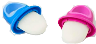
PICOLÉ DE FRUTAS OU DE LEITE MATERNO