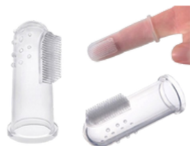
DEDEIRA PARA MASSAGEAR